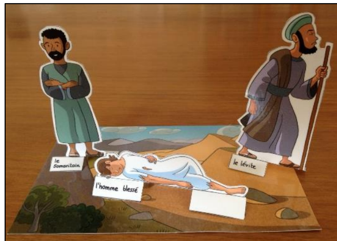
Du matériel didactique