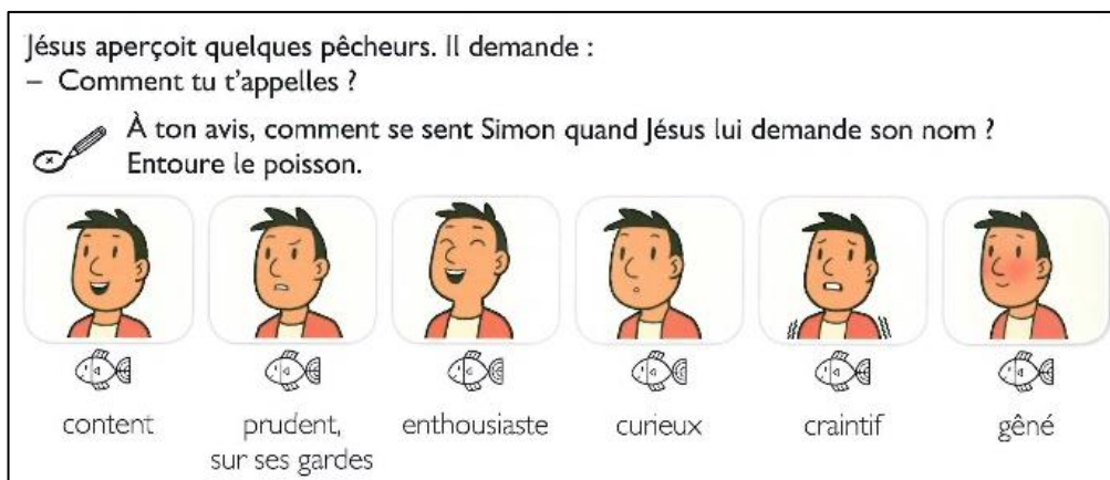
Des activités pour les enfants